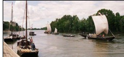
Les quais de Chalennes accueilleront pour la première fois la Fête des vins, décalée en mai pour sa 56 e édition.

Depuis l'ouverture de la pêche, effarement dans la cité chalonnaise : les pêcheurs capturent des centaines de sardines ! Les dernières grandes marées et le réchauffement climatique leur auraient donc fait remonter la Loire en quête d'eaux plus hospitalières. Des scientifiques, experts en ichtyologie, tentent d'analyser le phénomène et l'impact de ces colonies sardinières sur les brochets, sandres, anguilles, mais aussi sur la flore. Les habitants n'en reviennent pas de ces profusions de cupléidés, qui donnent aux berges de Loire des airs de grand large. Et si, de plus, elles bouchaient le port de Chalennes comme jadis celui de Marseille ?